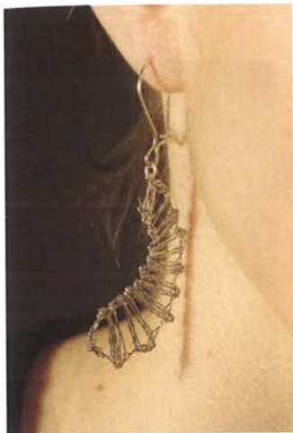
Tarmo on nyplännyt myös hopeisia korvakoruja.

ten sovimme, että pitsinäyttely järjestetään. Ongelma oli se, että minä olin saanut tuolloin oppia vasta hiukan, Atso ei ollut ikinä nyplännyt.