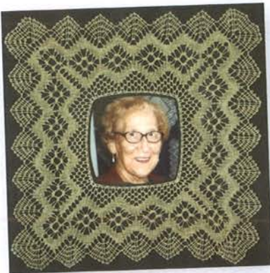
Impi in memorian -taulu on tehty mestarin muistolle.

–Olin itse silloin ulkomailla, mutta muistan tapauksen kyllä hyvin. Oli hyvin dramaattista menettää mestari juuri kyseisenä yönä.