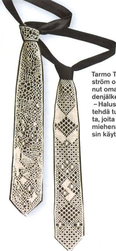
Tarmo Thorström on luonut oman kädenjälkensä. – Halusin tehdä tuotteita, joita myös miehenä voisin käyttää.