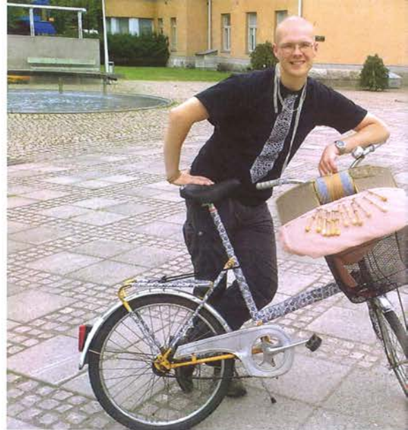
Fillarinyplääjän voit bongata kesällä Raumalta tai Porvoosta.