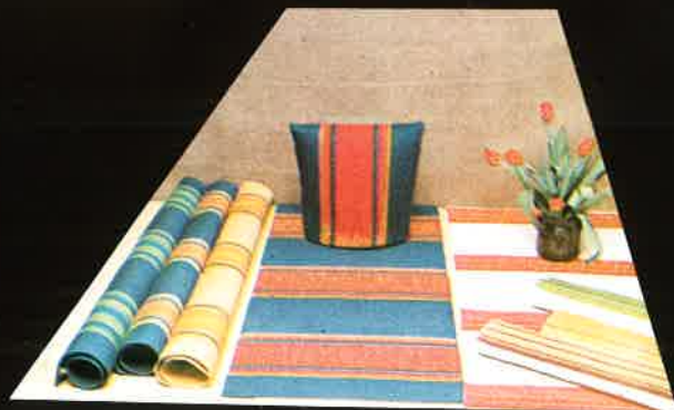
667 »Neliapila» 50x120, 130x180, 130x220