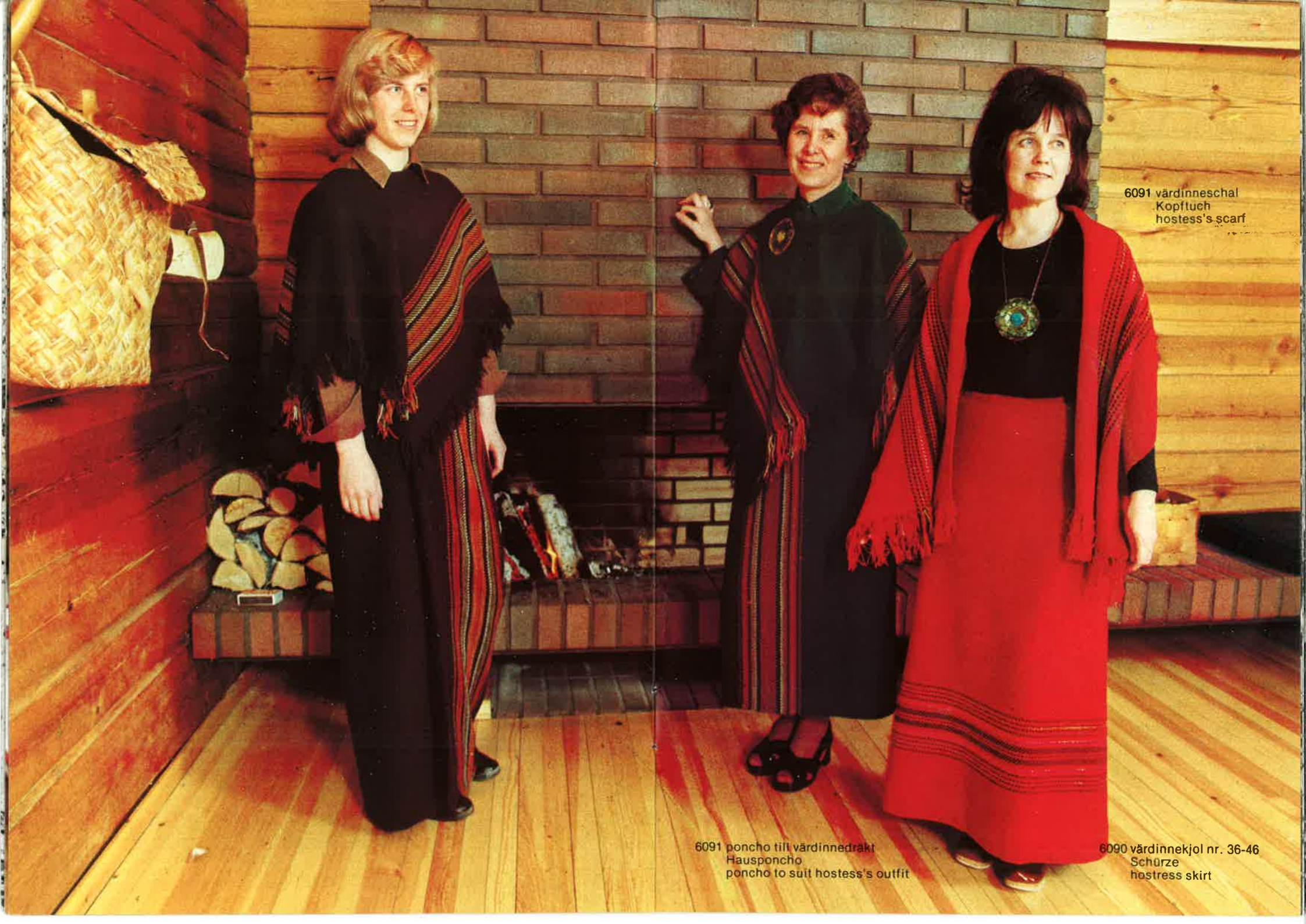
6091 vrdinneschal Kopftuch hostess's scarf