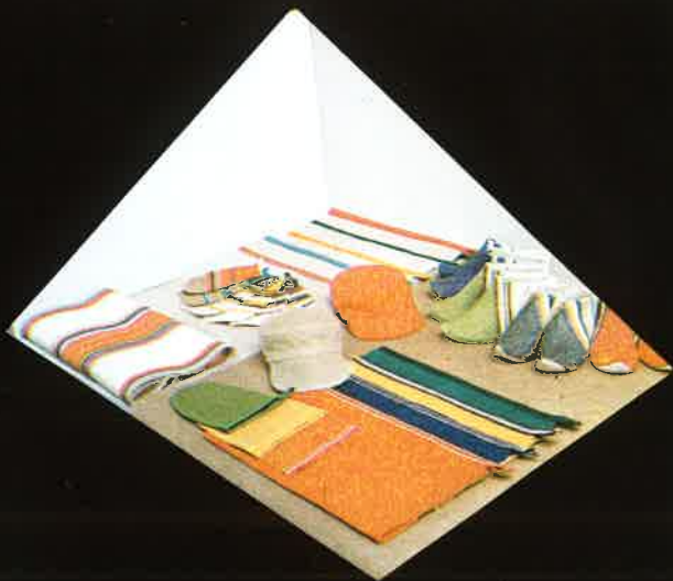
690 kaffeduk 130x130, 130x180, 130x220 Kaffeedecke coffee table cloth