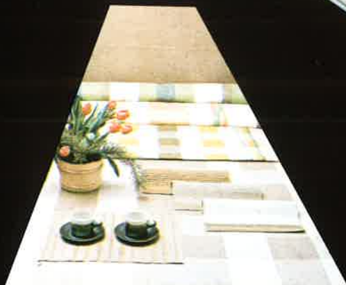
680 tablett 33x45 Platzdeckchen doily