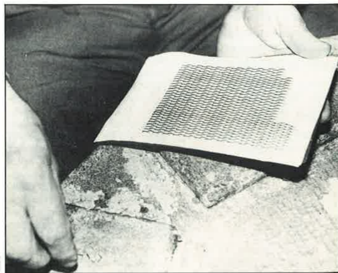
U-muotoiset karstapiikit pistetään käsin nahan läpi. Yhteen karstapariin tarvitaan noin 2000 piikkiä.